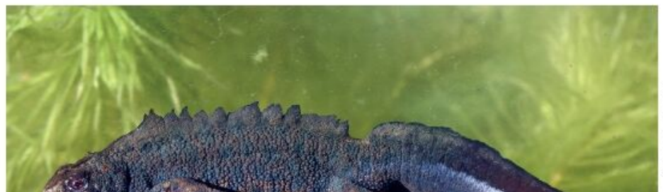
n zeigt seine Pracht