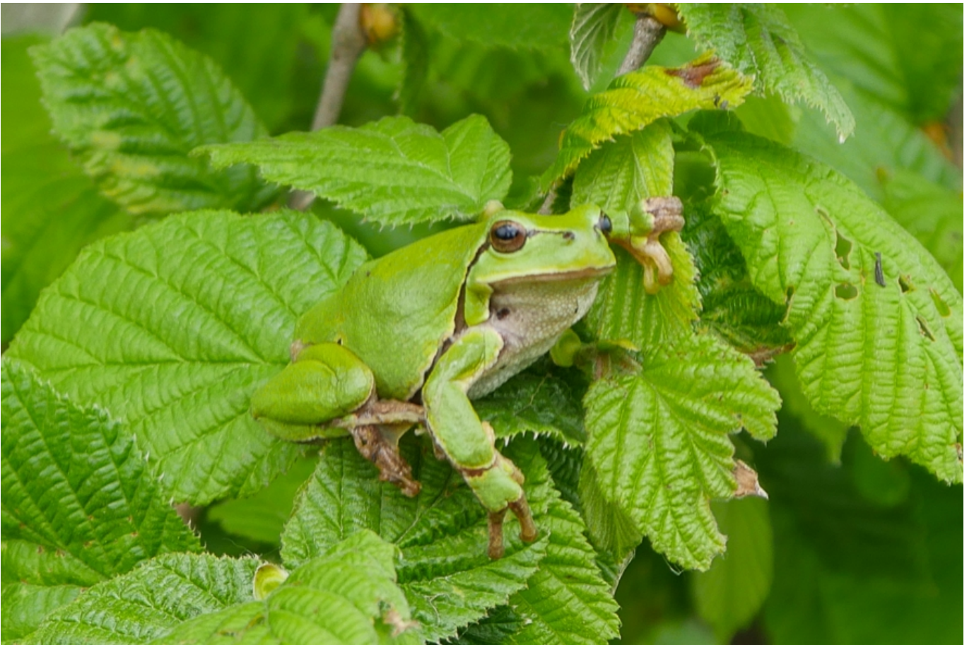
Netzwerk Natur Tullnerfeld II