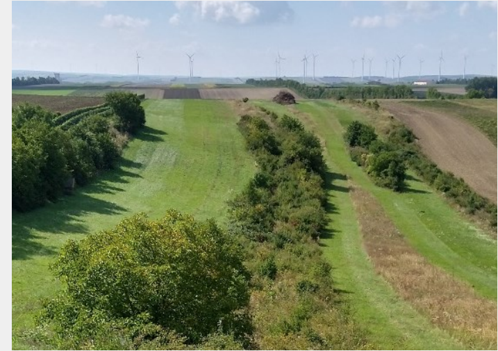
Abb. 13: Mehrnutzenhecken