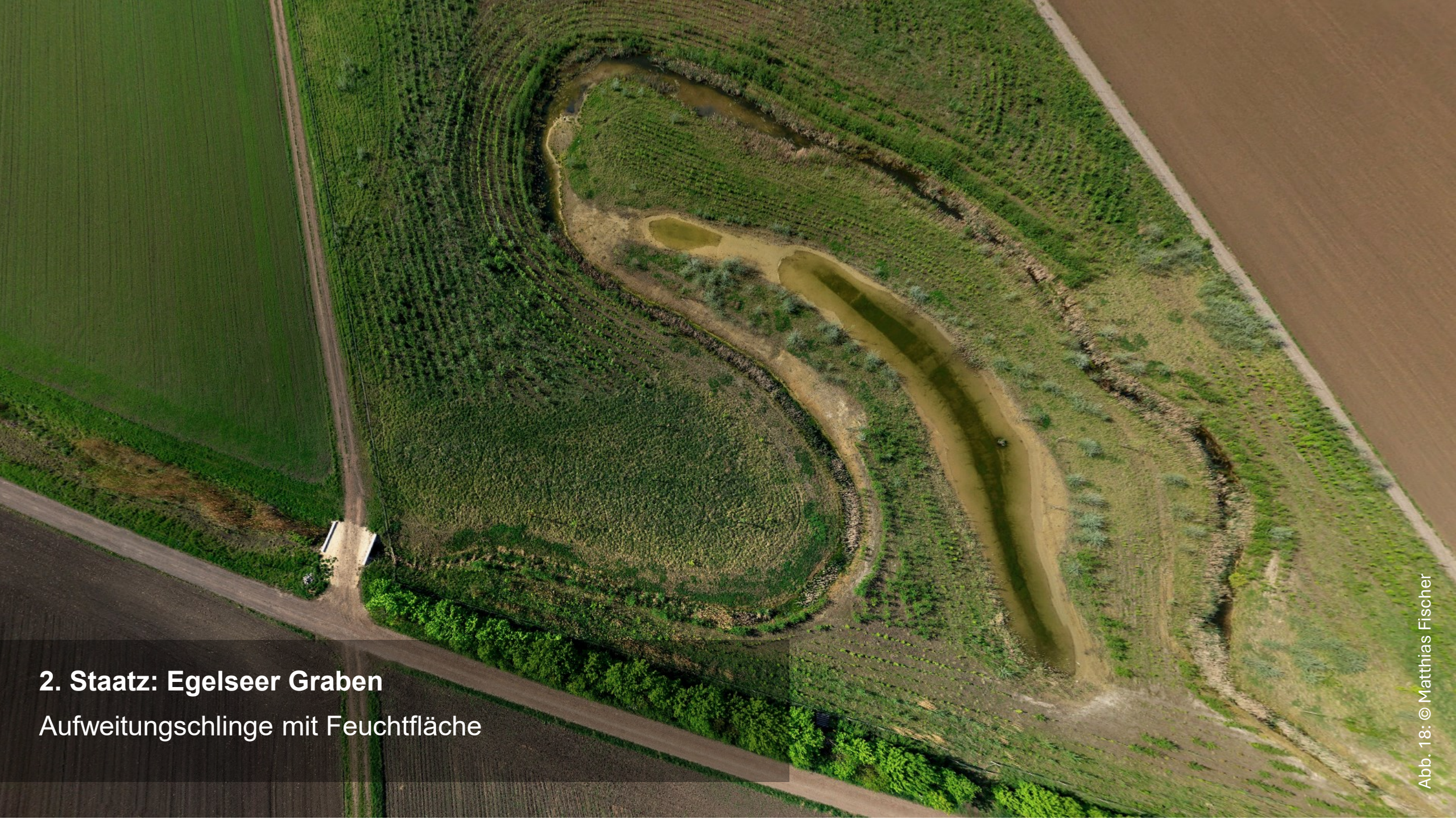
2. Staatz: Egelseer Graben Aufweitungsschlinge mit Feuchtfläche