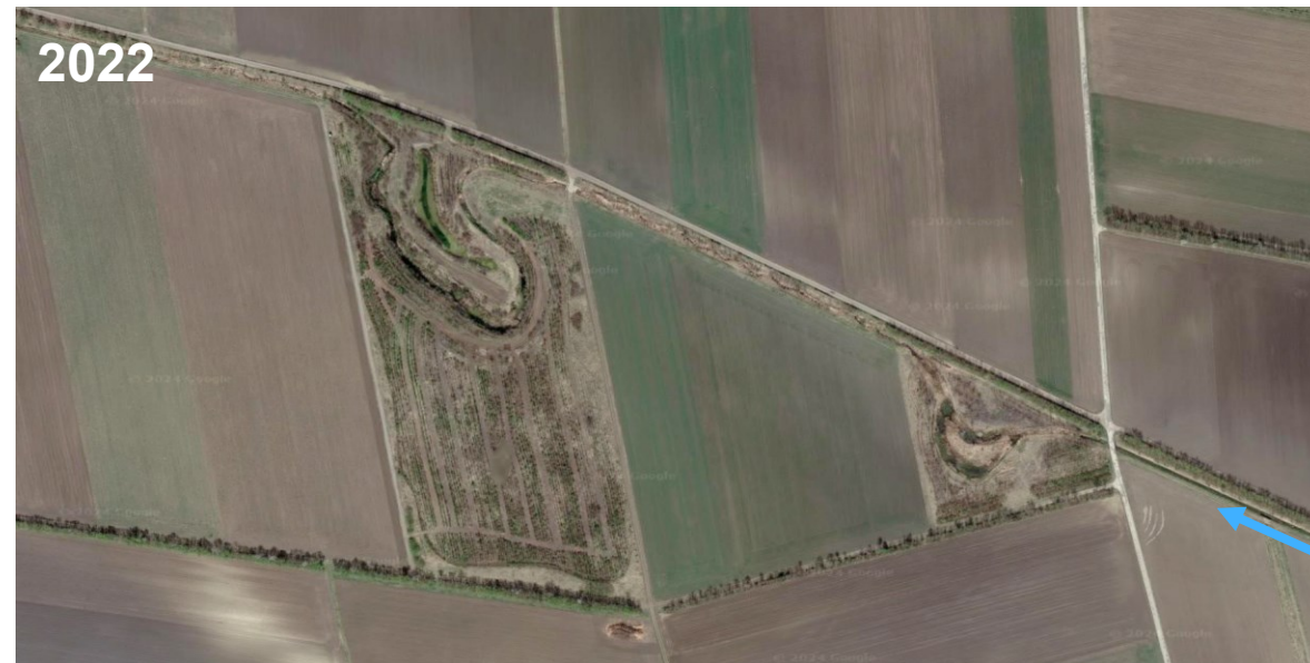
Abb. 16/17: Historische Satellitenbilder vor (oben) und nach (unten) der Projektumsetzung