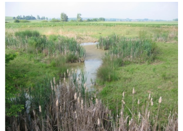
Abb. 8 -10: Ausgedehnte Feuchtgebiete im Retentionsraum der Zaya bei Mistelbach