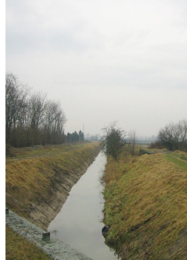
Abb. 4: Bach im Trapezprofil