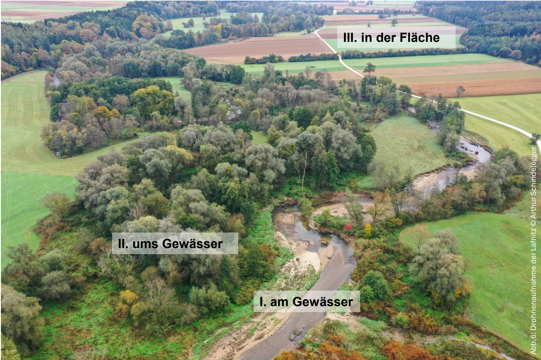
Abb. 6: Drohnenaufnahme der Lafnitz