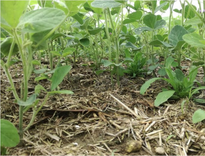
Abb. 11: Direktsaat bei Soja