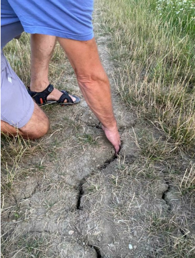
Abb. 2: Risse in trockenem Boden im Sommer 2023.