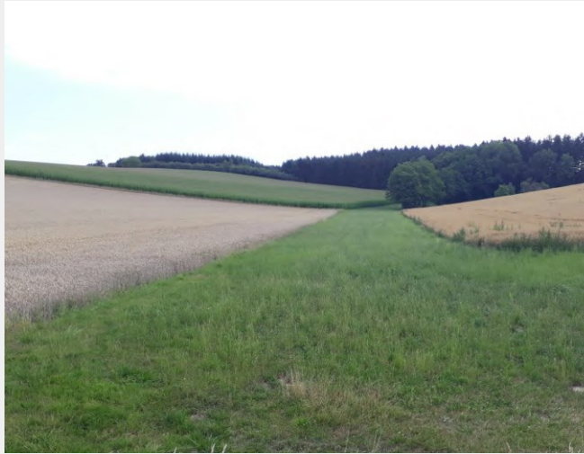
Abb. 12: Begrünter Abflussweg in Falllinie