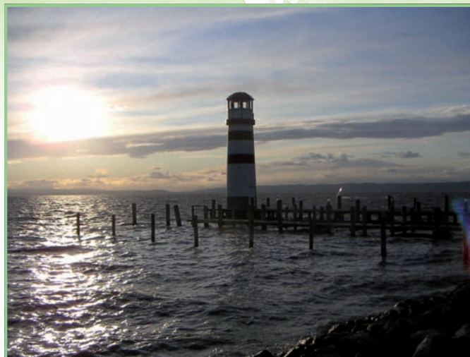
Wasserstandsschwankungen: eine Gefahr für unterschiedliche Nutzungsinteressen