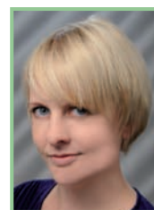
Autorin: Mag. Christina Zwickl, Esterhazy Betriebe GesmbH

Auch hier muss darauf geachtet werden, das Leben und die Arbeiten im Wald gemäß den Verhaltensregeln nicht zu stören. Für ein verständnisvolles Miteinander sollten Pilze ausschließlich in der Zeit zwischen 8 und 16 Uhr gesammelt werden.