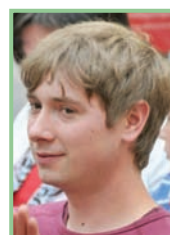
Autor und Fotos: DI Stefan Weiss, Mitarbeiter des Naturschutzbundes Burgenland

Eine Zusammenfassung der Ziele, Gefahren und Maßnahmen für den Neusiedlersee erfolgt in einer anwendungsorientierten Leitlinie für regionale Entscheidungsträger und Interessensgruppen. Diese soll informieren und Möglichkeiten aufzeigen, wie in konkreten Situationen gehandelt werden kann. Eine Präsentation der Ergebnisse und der Leitlinie findet in einer Abschlussveranstaltung im September 2013 statt.