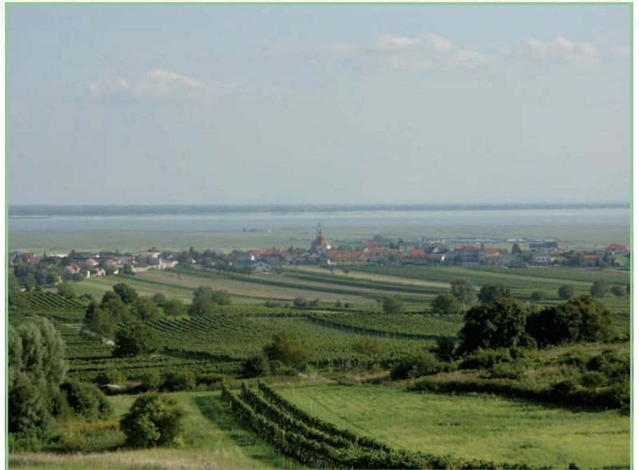
Vielfältige Kulturlandschaft am Beispiel von Jois

Zwischen 1976 und 2010 stiegen die Temperaturen in der Neusiedlerseeregion um 0,5° C pro Dekade an. Aufgrund der erhöhten Lufttemperatur stieg auch die Wassertemperatur des Neusiedlersees signifikant an. Die mittleren saisonalen Temperaturen am Neusiedler See lagen in der Peri-