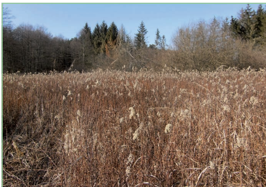
Punitz - Limbach

erhoben werden. In Folge entsteht nach Absprache mit Experten unterschiedlicher Fachrichtungen ein Pflegekonzept. Der Hauptteil umfasst die Organisation und Durchführung umfangreicher Pflegemaßnahmen in den Gebieten. In einem ersten Schritt sollen Verhandlungen mit den Grundeigentümern über die Bereitstellung der relevanten Flächen für die jeweiligen Pflegemaßnahmen und die nachfolgende Bewirtschaftung geführt werden. Zu den Vorarbeiten gehören auch