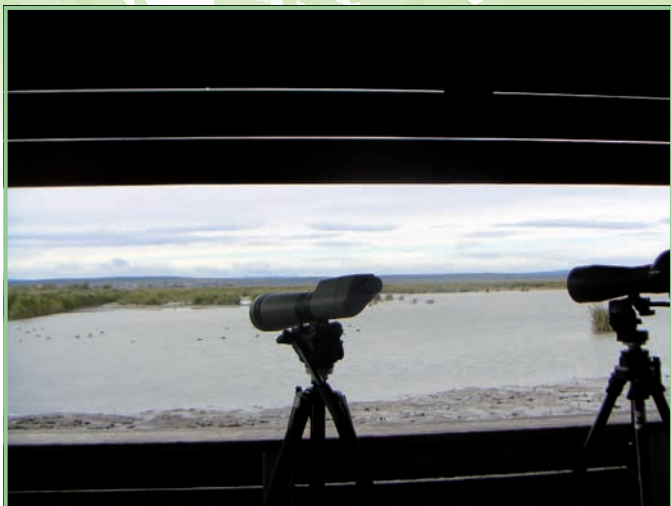
Naturtourismus gewinnt ständig an Bedeutung