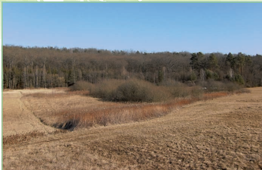
Punitz - Haselbach

chael Pušta) und Tobaj (Limbach südlich von Punitz, Haselgraben östlich von Punitz).