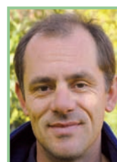
Autor: Mag. Manfred Fiala, Dietmar Igler, Mitarbeiter des Naturschutzbundes Burgenland

Außerdem sorgen diese „Lebens“räume, die sich im Vergleich zu den totgespritzten Agrarflächen ihren Namen noch erhalten haben, für eine Ästhetik und damit für ein Wohlfühlgefühl in uns Menschen, das viele von uns immer mehr vermissen.