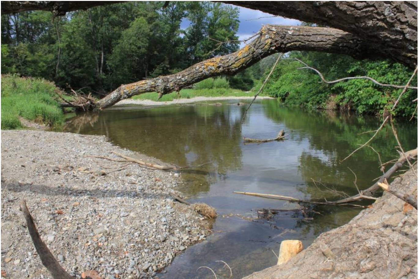
Die Schwechatau bei Tribuswinkel

Die Alpen und die Karpaten mit ihren vorgelagerten artenreichen Landschaften sind ähnliche Großlebensräume. Die Beckenlandschaft, die die beiden Gebirgszüge voneinander trennt, ist heute intensiv genutzt und durch zahlreiche Infrastruktureinrichtungen wie Straßen, Eisenbahnstrecken, Hochspannungsleitungen usw. fragmentiert. Das führt dazu, dass Arten von einem in den anderen Großlebensraum kaum mehr wandern können. Neben dem Verlust von naturnahen Lebensräumen in den Beckenlandschaften und den damit einhergehenden Ökosystemleistungen, die diese für den Menschen erbringen, geht damit auch die Vernetzung der beiden Gebirgsregionen verloren.